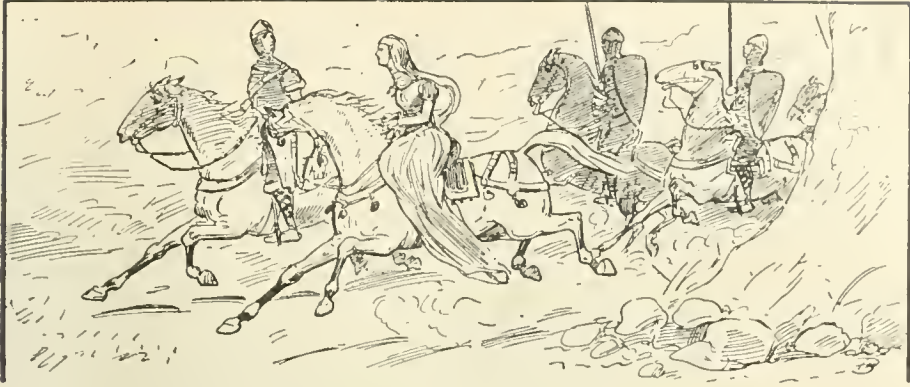
La reine galopait sur la route d'Oxford. (page 215)